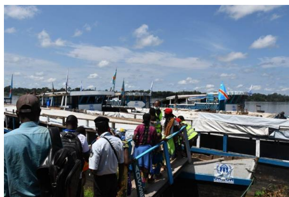
Des réfugiés du camp de Boyabu, dans la province du Sud-Ubangi, rentrent à Bangui en bateau grâce au soutien du HCR et de la CNR