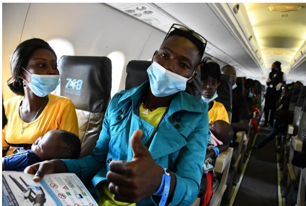
Une famille de réfugiés centrafricains rentre en RCA avec le vol humanitaire UNHAS entre Gbadolite et Bangui, après avoir vécu pendant huit ans au sein du camp d'Inke en RDC, dans la province du Nord-Ubangi

En novembre, 15 756 réfugiés ont reçu une aide alimentaire en espèces grâce au PAM dans le territoire de Bosobolo, province du Nord Ubangi.