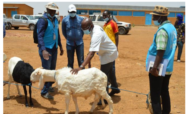
« Visite des expositions et réalisations lors de la JMR 2021 »