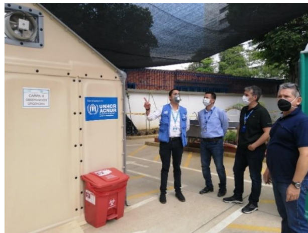
7 Refugee Housing Units instaladas en el Hospital Universitario de Santander en Bucaramanga.

1.327 personas alcanzadas con entrega de efectivo multipropósito en los municipios de Bucaramanga, Piedecuesta, Floridablanca y Girón.