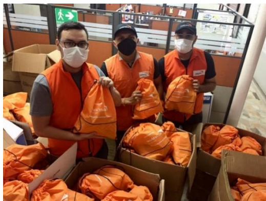
Entrega de kits de higiene y kits energéticos.

Articulación para implementar la modalidad de entrega de efectivo, ya sea para fines de arrendamiento o multipropósito en municipios como Bucaramanga para la población que no cuenta con medios de vida debido a la medida de cuarentena originada en el marco de la pandemia.