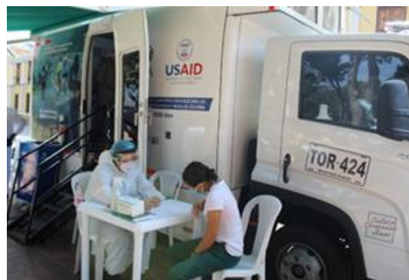
Atención en salud a migrantes en tránsito a Villa Asunción, Bucaramanga