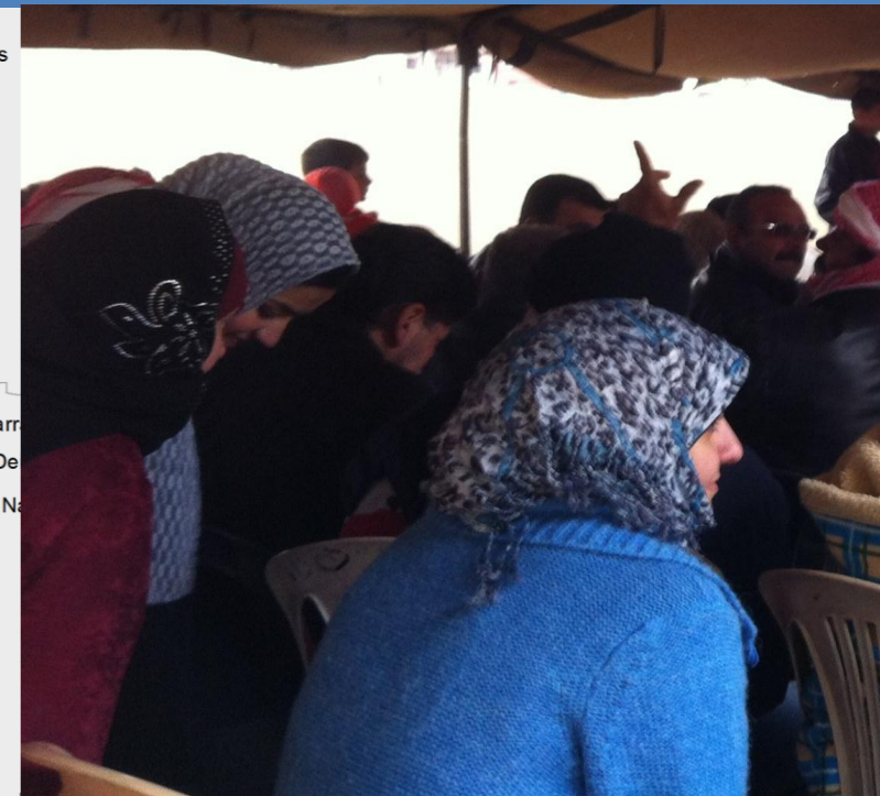
يجري التسجيل لدى البلدية بشكل منتظم من أجل ضمان حصول الوافدين الجدد على المساعدة. عرسال 2013-11-29