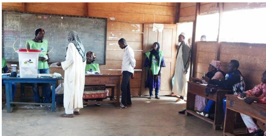
Les réfugiés centrafricains participent aux élections dans le site de Mbilé dans la région de l'Est.