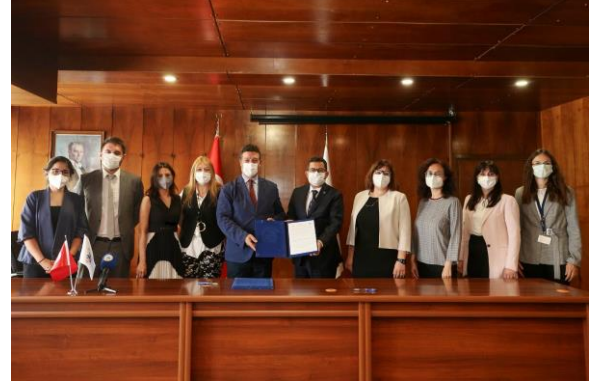
UNHCR, farklı faaliyet alanlarında devam eden işbirliğini güçlendirmek üzere Dokuz Eylül Üniversitesi ile bir Mutabakat Metni imzaladı

UNHCR Türkiye Temsilcisi, 10-11 Haziran tarihlerinde Mersin'in Tarsus ilçesinde uluslararası koruma ihtiyacı içindeki çocukların spor etkinliklerine katılımını sağlamak üzere düzenlenen futbol maçının başlama vuruşunu yapmıştır. Tarsus Belediye Başkanının ev sahipliğinde Tarsus Kaymakamının ve kamu ve STK görevlilerinin yer aldığı çalışma yemeğinde olası işbirliği alanlarını ele alan Leclerc, Mersin Valisi ve üst düzey yetkililerle yaptığı toplantılarda koruma alanındaki çalışmalarını geliştirmek üzere UNHCR ile ilgili kurumlar arasında işbirliği imkânlarını görüşmüştür.