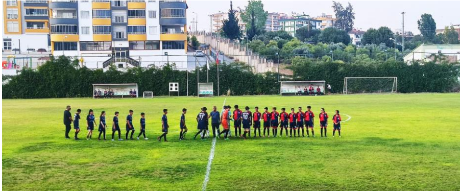
Tarsus'taki dostluk maçında Türk gençler yabancı gençlerle bir araya geldi.

UNHCR Türkiye Temsilcisi, İran sınırında düzensiz göç durumunu incelemek üzere ziyaretlerine devam etmiştir. Leclerc, ziyaretleri sırasında Van ve Ağrı Valileri, Çaldıran ve Doğubayazıt Kaymakamlarının yanı sıra Van ve Ağrı'da İGİM yetkilileri, kolluk, jandarma ve polis görevlileriyle bir araya gelmiştir. Sınırlardaki hareketlilik, sorunlar ve İGİM işbirliğiyle UNHCR tarafından sağlanabilecek desteğin çerçevesi konuları ele alınmıştır.