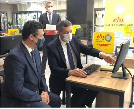
Millî Eğitim Bakanı ve UNHCR Türkiye Temsilcisi, EBA Destek Noktaları'nın açılış töreninde bir araya geldi.