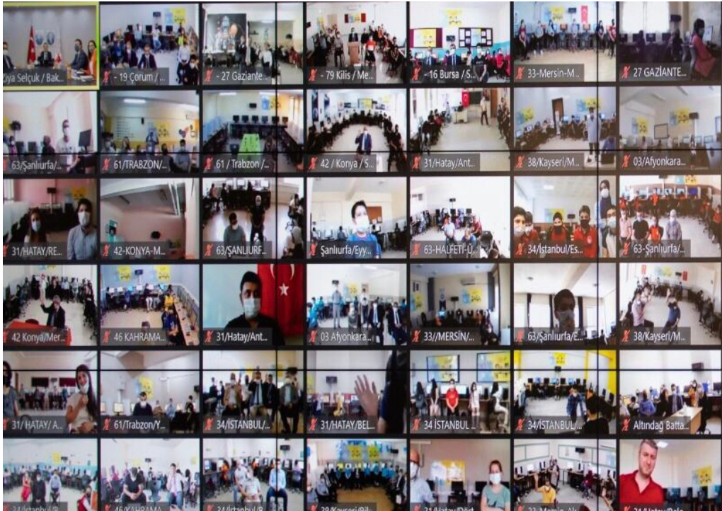
Millî Eğitim Bakanlığı ile UNHCR işbirliğinde 16 ildeki 114 okulda kurulan EBA Destek Noktaları'ndaki öğrenci ve öğretmenler.