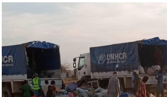
Retour des réfugiés au camp de Goudoubo à bord des camions affectés par UNHCR