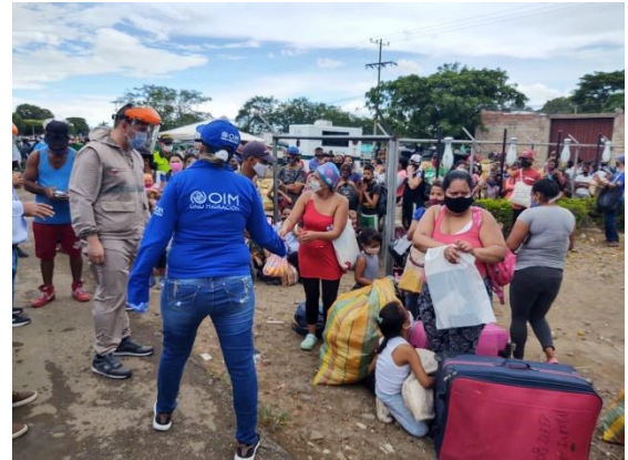
Apoyo a refugiados y migrantes en el sector de La Parada- Villa del Rosario.

En el CAST, de forma complementaria a las autoridades, se mantienen los servicios de agua, saneamiento e higiene, atención en salud y atención psicológica, protección.