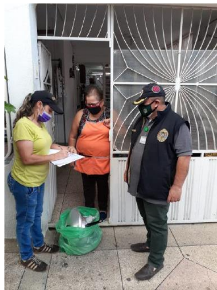
Entrega de elementos no alimentarios a familias vulnerables con vocación de permanencia en el sector del Escobal – Cúcuta. / Capellanía OFICA