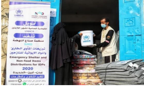
أحد الموظفين العاملين لدى أحد شركاء المفوضية يسلم عبوة لامرأة نازحة أثناء توزيع مواد غير غذائية في زنجبار في محافظة أبين.

شكر خاص للجهات المانحة الرئيسية: صندوق ثاني بن عبدالله بن ثاني آل ثاني الإنساني | الولايات المتحدة الأمريكية | السويد | الدانمارك | النرويج | هولندا | المملكة المتحدة | ألمانيا | سويسرا | اليابان | كندا | الجهات المانحة الخاصة من اسبانيا | الجمعية الكويتية للإغاثة | الجهات المانحة الخاصة من جمهورية كوريا.