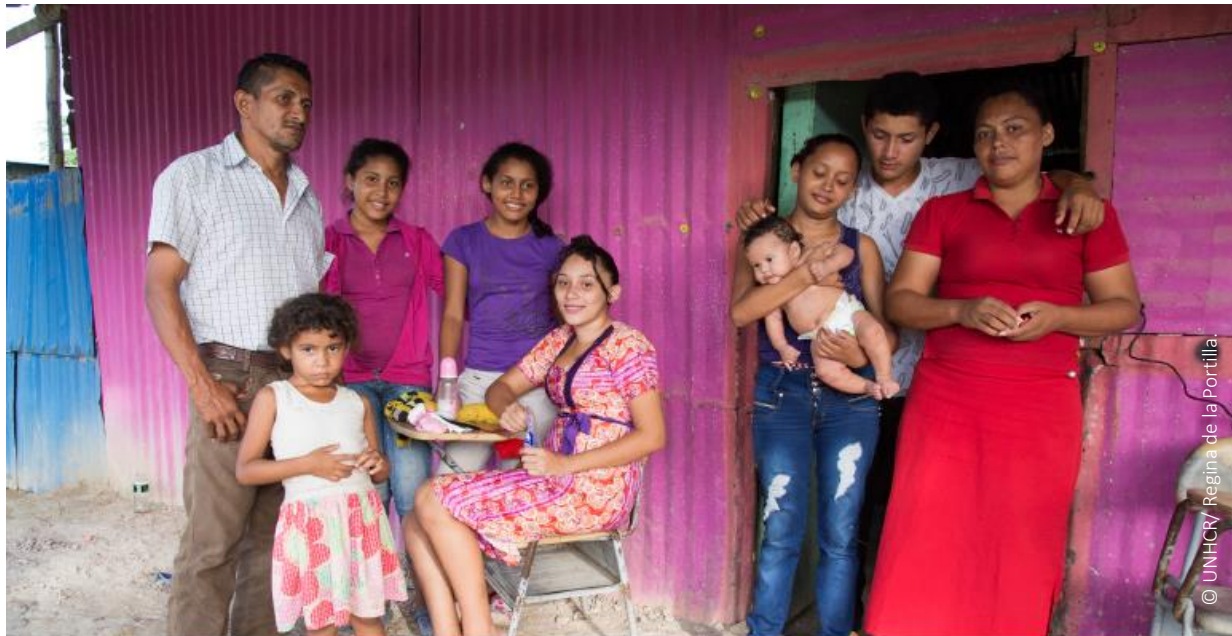
Familia venezolana vive en asentamiento informal en Arauca mientras espera el reconocimiento de la condición de refugiado.

El Grupo Interagencial sobre Flujos Migratorios Mixtos (GIFMM) fue creado a finales del 2016. Es co-liderado por OIM y ACNUR. Funciona como un espacio de coordinación para la respuesta a la situación de refugiados y migrantes en Colombia. Tiene 46 miembros, incluyendo agencias de Naciones Unidas, ONGs y el Movimiento de la Cruz Roja. El GIFMM tiene como objetivo principal coordinar la respuesta a las necesidades de refugiados, migrantes, retornados y poblaciones de acogida, de forma complementaria con el Gobierno.