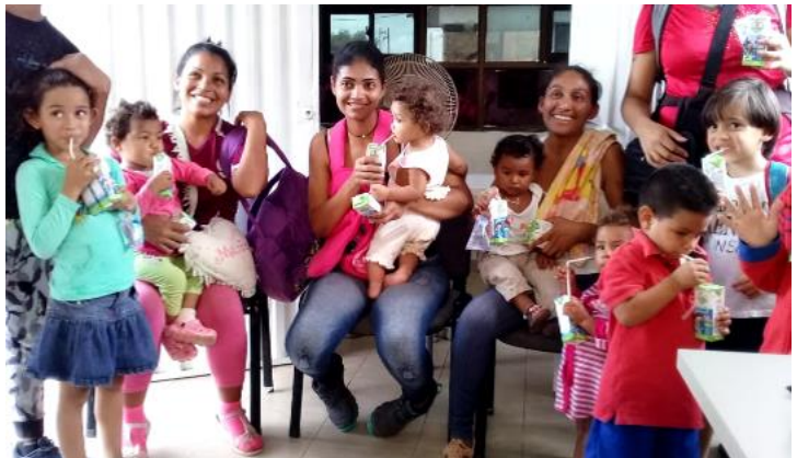
Venezolanos recibiendo orientación y asistencia alimentaria en el Punto de Orientación y Atención en Paraguachón, La Guajira.