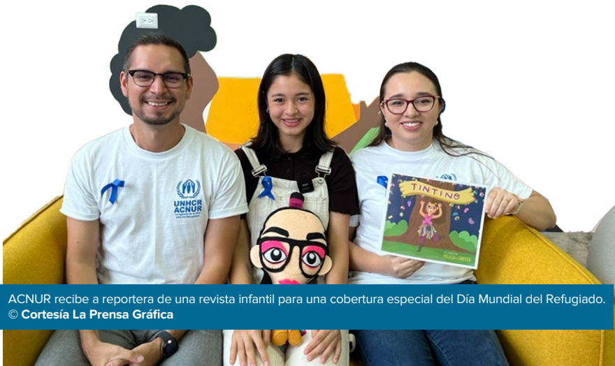
ACNUR recibe a reportera de una revista infantil para una cobertura especial del Día Mundial del Refugiado.