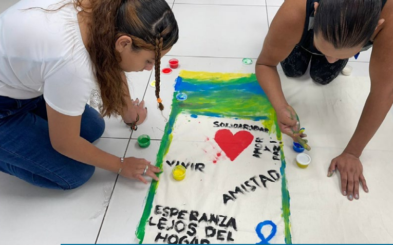
Mujeres en un centro comunitario pintan mensajes inspirados en el tema del Día Mundial del Refugiado "Esperanza lejos de casa".