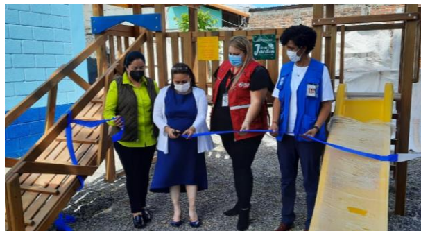
Inauguración de la escuela remozada y equipada en la aldea Las Majadas, Jutiapa.