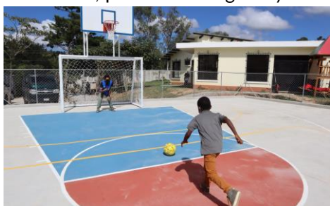
Nueva cancha polideportiva en Esquipulas.

charlas informativas dos veces por semana a personas en tránsito que están alojadas en el albergue para identificar personas con necesidad de protección internacional e informarles sobre sus derechos. De esta manera, en 2021, se ha informado a más de 500 personas que forman parte de los movimientos mixtos .