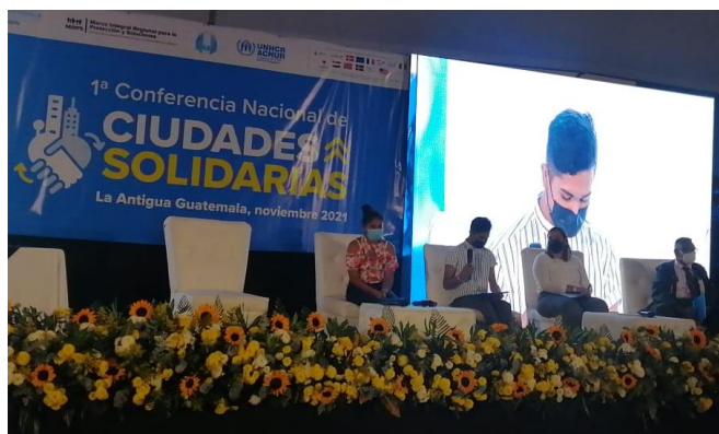
La primera Conferencia Nacional de Ciudades Solidarias organizada por el Gobierno de Guatemala, la Asociación Nacional de Municipalidades (ANAM) y el ACNUR tuvo lugar en Antigua Guatemala con la participación de personas refugiadas.