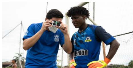
Junto con la ONG Goal Click se organizó una exposición fotográfica en Quibdó para promover la integración social a través del fútbol.

Para más información sobre la respuesta del ACNUR, consulte el Panel de Respuesta del ACNUR .