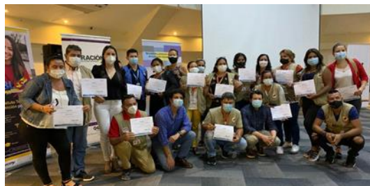
En colaboración con las autoridades migratorias de Colombia y el ACNUR, la Federación Nacional de Defensores del Pueblo (Fenalper) impartió formación sobre el ETPV a representantes de Norte de Santander