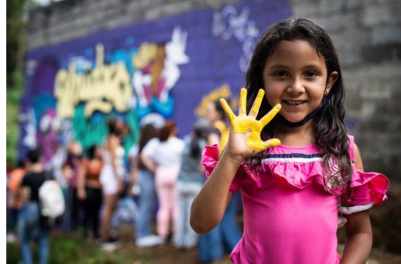
Una niña participa en la pintura de un mural con un mensaje de unidad en el barrio Bello Oriente de Medellín.