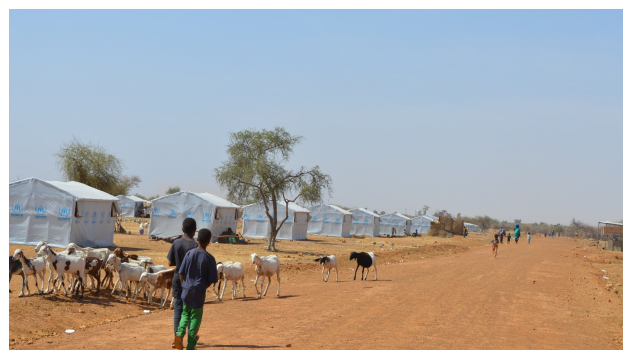
Une vue partielle du camp de Goudoubo après la rélocalisation des réfugiés