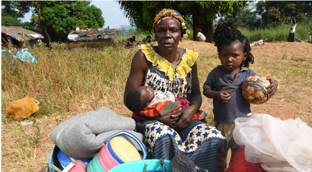
Une mère assise avec deux de ses enfants à Ndu en République démocratique du Congo après avoir fui son village situé à Bangassou en République Centrafricaine