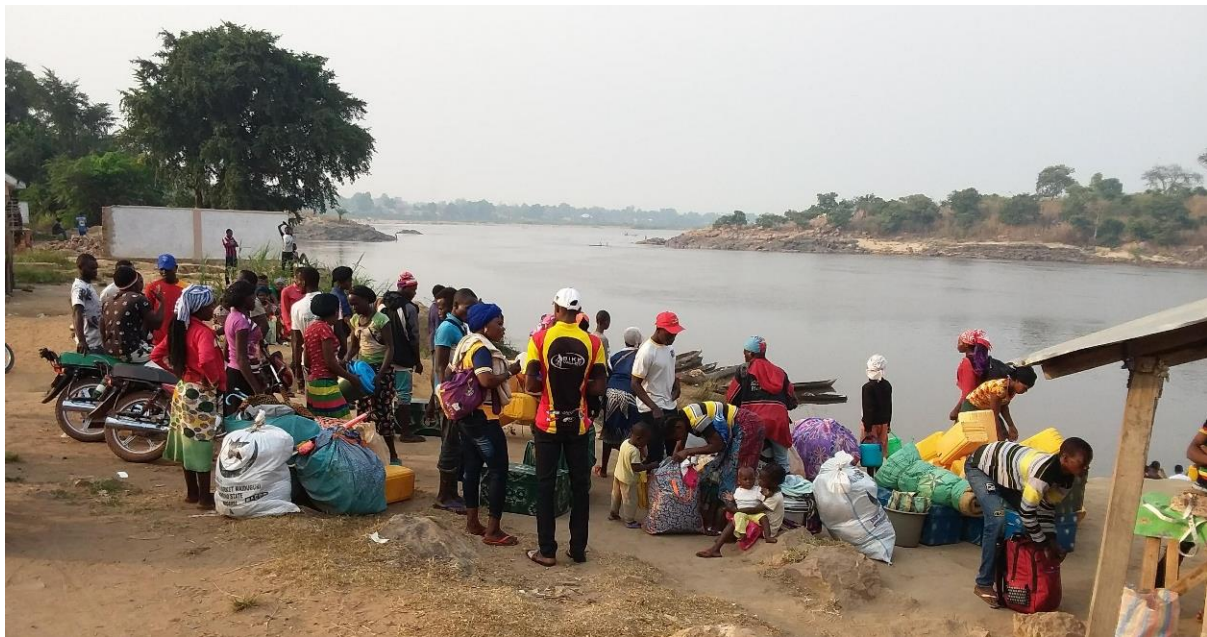
De nouveaux arrivants installés au bord de la rivière Ubangi à Zongo, province du Sud Ubangi