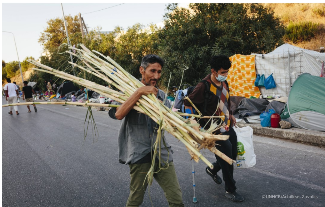
Αιτών άσυλο μεταφέρει μπαμπού για να φτιάξει ένα αυτοσχέδιο κατάλυμα για την οικογένειά του, μετά την καταστροφή του κέντρου υποδοχής και ταυτοποίησης στη Μόρια από τη φωτιά.

9 Γραφεία σε Θεσσαλονίκη, Λέσβο, Χίο, Σάμο, Κω, Έβρο, Ιωάννινα, Λέρο και Ρόδο