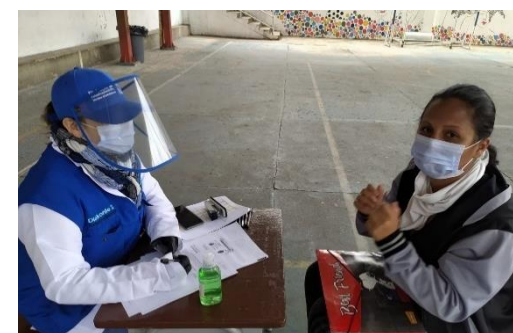
Entrega de efectivo multipropósito y orientación sobre transferencias monetarias a refugiados y migrantes, especialmente a los jefes de hogar, en el municipio de

68.100 BENEFICIARIOS EN JULIO 34.629 POR ACTIVIDADES COVID-19