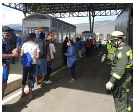
Procesos de tamizaje para la población refugiada y migrante en punto de ingreso en Villa del Rosario.

Durante el mes, más de 68.300 beneficiarios recibieron una o más asistencias a través de 62 socios e implementadores del RMRP, en 263 municipios de 29 departamentos a lo largo del territorio nacional.