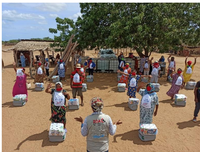
En Uribia, La Guajira, más de 80 familias refugiadas, migrantes, retornadas y de la comunidad de Yotojoroín recibieron kits de higiene familiar y orientación sobre soluciones domiciliarias para el lavado de manos.

Las principales acciones del sector comprendieron la entrega de kits y elementos clave de saneamiento e higiene para más de 56.300 refugiados y migrantes, considerando las necesidades diferenciales de mujeres, niñas, niños, adolescentes, madres gestantes, entre otros perfiles. Así mismo, más de 28.600 personas -incluyendo población receptora- accedieron a agua segura y saneamiento básico en sus comunidades. También se destaca el acceso diario a servicios de agua y saneamiento en puntos de prestación de servicios (centros de salud, albergues, comedores, escuelas, etc.) para más de 26.700 personas, entre ellas más de 2.700 niños, niñas y adolescentes que accedieron a dichos servicios en espacios de aprendizaje y espacios de desarrollo infantil. Igualmente, más de 9.500 personas recibieron servicios de agua y saneamiento a nivel comunitario e institucional.