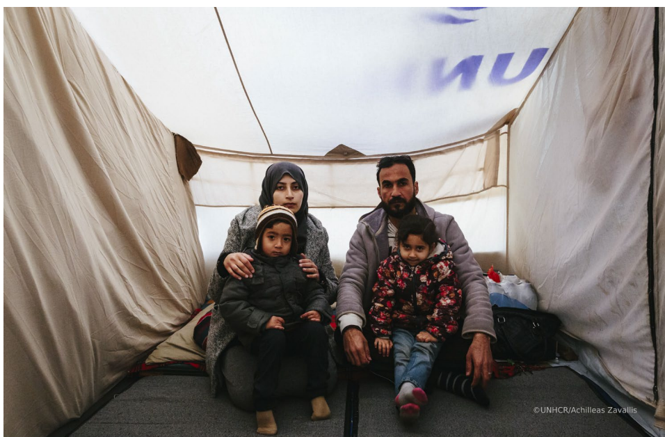
Αιτούντες άσυλο μέσα σε μια σκηνή οικογενειακού τύπου της Υ.Α., στο κέντρο υποδοχής στη Μόρια, στη Λέσβο.

9 Γραφεία σε Θεσσαλονίκη, Λέσβο, Χίο, Σάμο, Κω, Έβρο, Ιωάννινα, Λέρο και Ρόδο