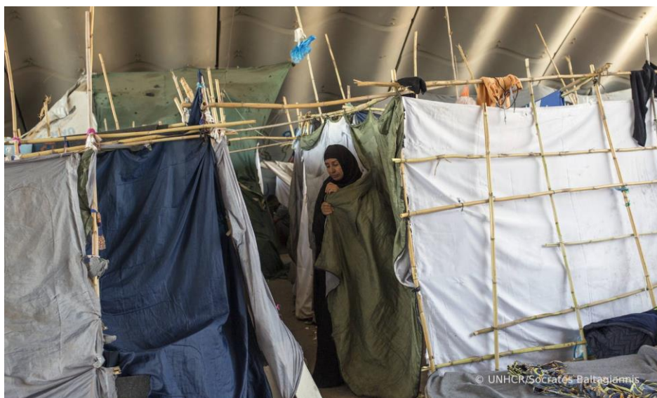
Μια γυναίκα πρόσφυγας στο Κ.Υ.Τ. στο Πυλί, στην Κω.

10 Γραφεία σε Θεσσαλονίκη, Λέσβο, Αττική, Χίο, Σάμο, Κω, Έβρο, Ιωάννινα, Λέρο και Ρόδο