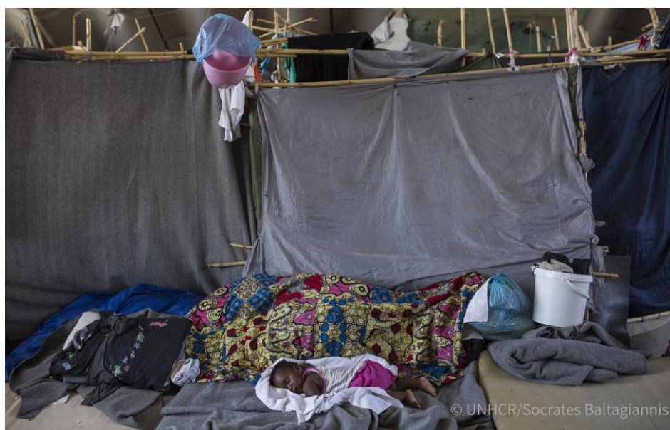
Λόγω του υπερπληθυσμού οι αιτούντες άσυλο αντιμετωπίζουν αντίξοες συνθήκες στο κέντρο υποδοχής στο Πυλί στην Κω.

10 Γραφεία σε Θεσσαλονίκη, Λέσβο, Αττική, Χίο, Σάμο, Κω, Έβρο, Ιωάννινα, Λέρο και Ρόδο