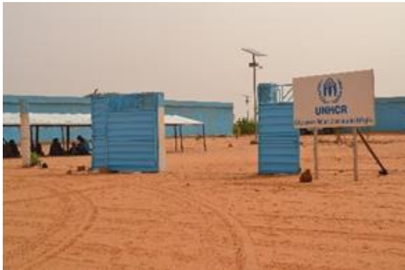
مكتب الحماية التابع للمفوضية في مخيم مبيرا.

تساعد المفوضية ما مجموعه 58,838 شخصاً في موريتانيا