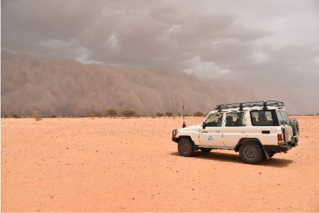
في نهاية شهر مايو، ألحقت عاصفة رملية قوية الضرر بالكثير من المنشآت في مخيم مبيرا.

تقود المفوضية الاستجابة الإنسانية للاجئين الماليين في منطقة الحوض الشرقي منذ عام 2012 بالتعاون مع الحكومة الموريتانية التي تبقي حدودها مفتوحة أمام التدفقات الجديدة، وبالتنسيق مع وكالات الأمم المتحدة الأخرى والمنظمات غير الحكومية الوطنية والدولية. وعلى الرغم من إبرام اتفاقية سلام في مالي في يونيو 2015، من غير المتوقع بعد أن تحدث حركات عودة كثيفة للاجئين بسبب الوضع الأمني في شمال مالي. في يونيو 2016، أبرمت موريتانيا ومالي والمفوضية اتفاقية ثلاثية لإعادة الطوعية للاجئين الماليين. وعندما تسمح الظروف في مالي بالعودة، ستوفر هذه الاتفاقية إطاراً لتسهيل العودة الطوعية. وحتى ذلك الحين، هي تعيد التأكيد على التزام موريتانيا ومالي بحماية اللاجئين. في اجتماع إقليمي عُقد في نيامي (النيجر)، أعادت المفوضية التأكيد على أن الظروف في مالي غير ملائمة لعودة اللاجئين. ولكن يمكن للمفوضية أن تسهل العودة الطوعية بناء على الطلب، وعلى أساس كل حالة على حدة.