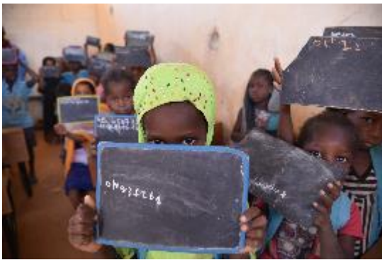
أطفال يحضرون صفّاً في مادة الرياضيات في واحدة من المدارس الست في مخيم مبيرا.

■ في شهر مايو، شارك 80 طالباً من مخيم مبيرا في دورة توعية بعنوان "حق الطفل في الذهاب إلى المدرسة" وتم تدريب 19 مدرساً جديداً (18 رجلاً وامرأة واحدة) على مدونة سلوك المفوضية وحقوق الطفل وحماية الطفل وتقنيات التواصل مع الطفل. وهدف التدريب لدعم المدرسين في تحديد الأطفال الذين يعانون من