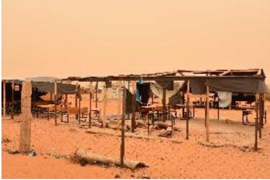
ألحقت العاصفة الرملية أضراراً كبيرة بالمدارس في مخيم مبيرا.