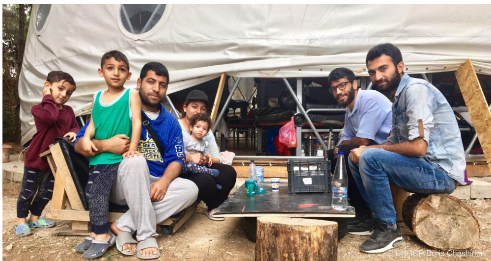
Μια οικογένεια Κούρδων από τη Συρία, στο κέντρο εθελοντών του ΠΙΚΠΑ στη Λέσβο.

6 Γραφεία σε Λέσβο, Χίο, Σάμο, Λέρο, Κω και Ρόδο