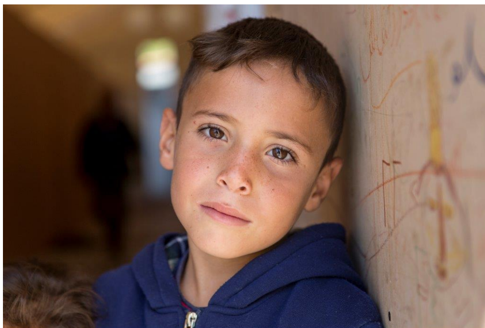
A Syrian boy in the Samos island Reception and Identification Centre of Vathy, September 2017