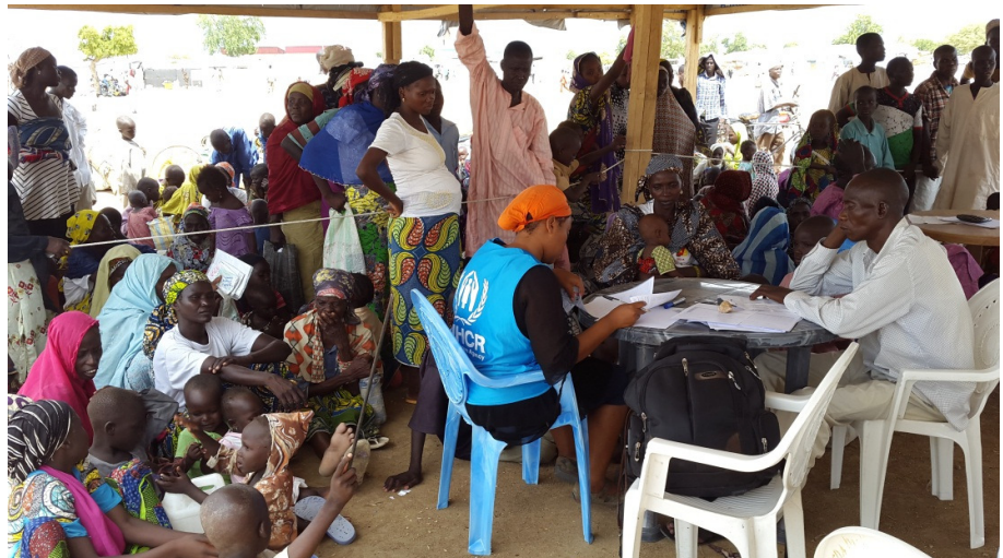
Enregistrement des réfugiés arrivés spontanément au camp de Minawao.