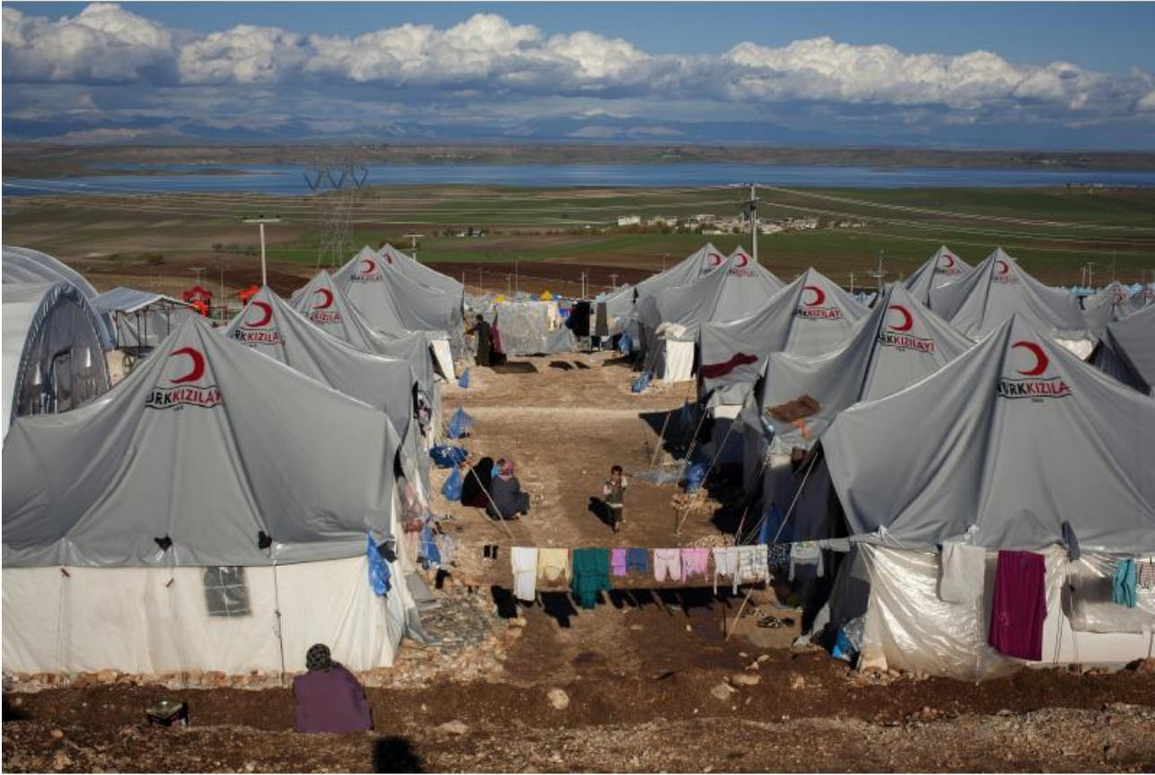
طفل سوري يقف وسط الخيام المقدمة من جمعية الهلال الأحمر التركي للاجئين المقيمين في مخيم أديمان. تقدم المفوضية الدعم التقني للحكومة لمساعدة اللاجئين.