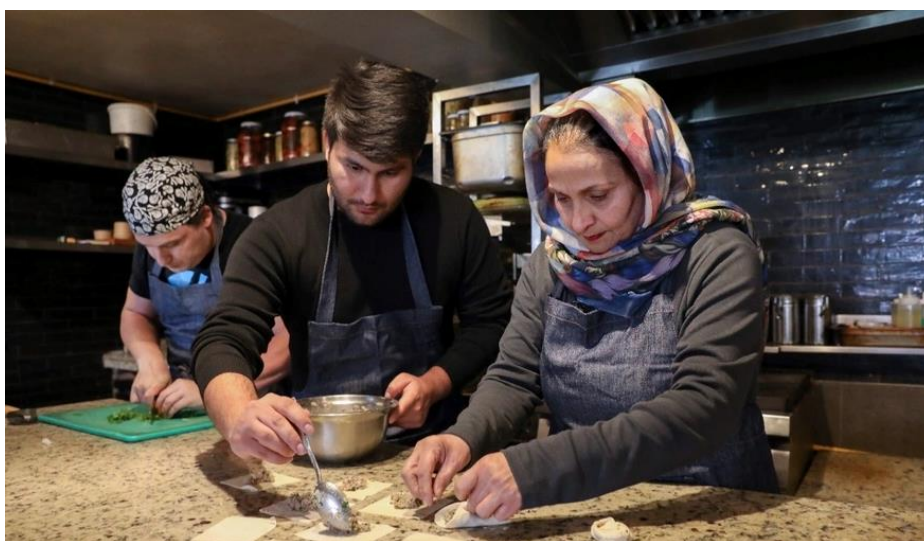
En el marco del Día Mundial del Refugiado, ACNUR lanzó la segunda versión del recetario nacional "Mi Mesa es tu Mesa: el sabor de compartir" que busca promover la diversidad y la valoración de las distintas culturas que conviven en Chile. Más información https://mimesaestumesa.cl/ .