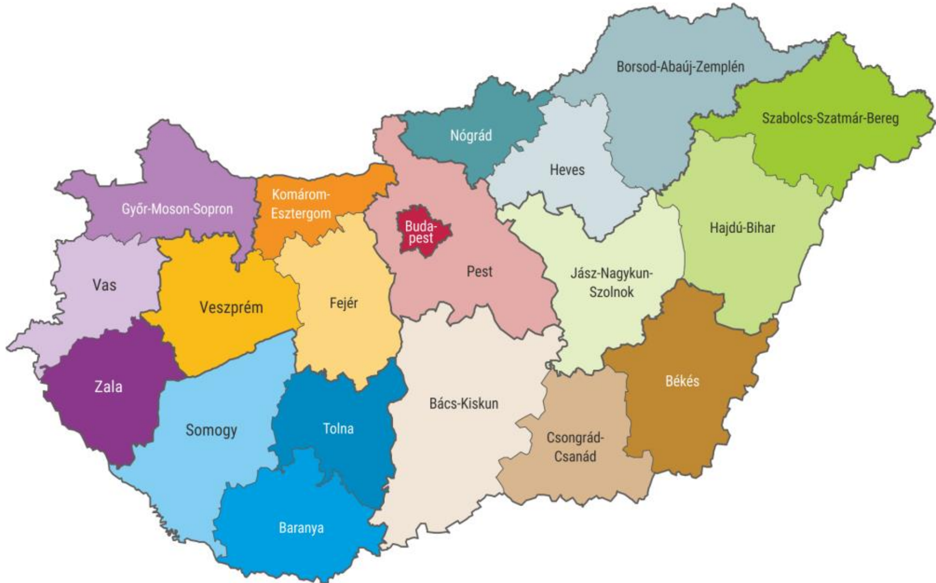
Додаток I – Мапа медье Угорщини