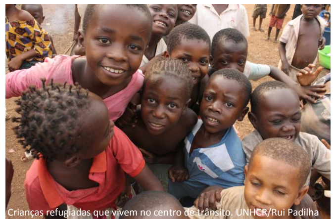
Crianças refugiadas que vivem no centro de trânsito.